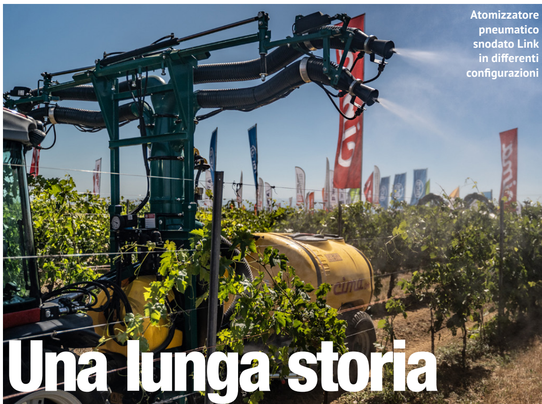
Atomizzatore pneumatico snodato Link in differenti configurazioni