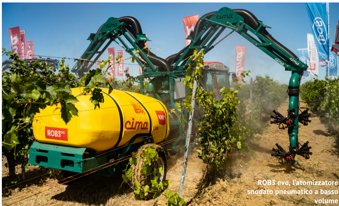
ROB3 evo, l'atomizzatore snodato pneumatico a basso volume

tra campo e azienda che rende possibile il controllo a distanza del macchinario, grazie a un software gestionale fornito in abbonamento, che consente di inviare i parametri di configurazione all'atomizzatore, registrare i dati in tempo reale durante il trattamento e visualizzare anche da remoto tutte le informazioni sul lavoro svolto, anche grazie alla georeferenziazione.