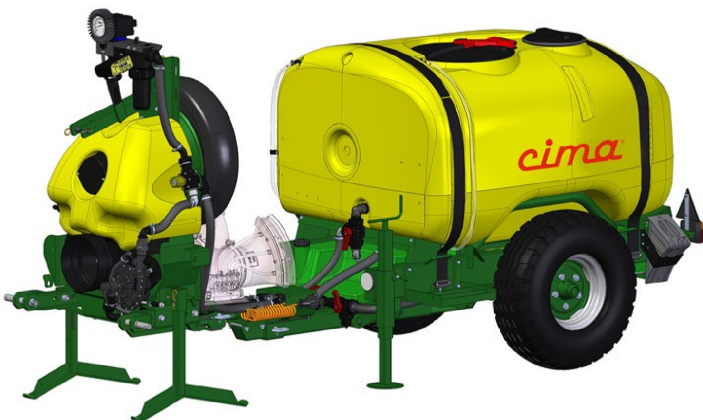
LINK 50 - Atomizzatore snodato

ATOMIZZATORE SNODATO PNEUMATICO A BASSO VOLUME LINK 50 CON TESTATA GREEN HUG