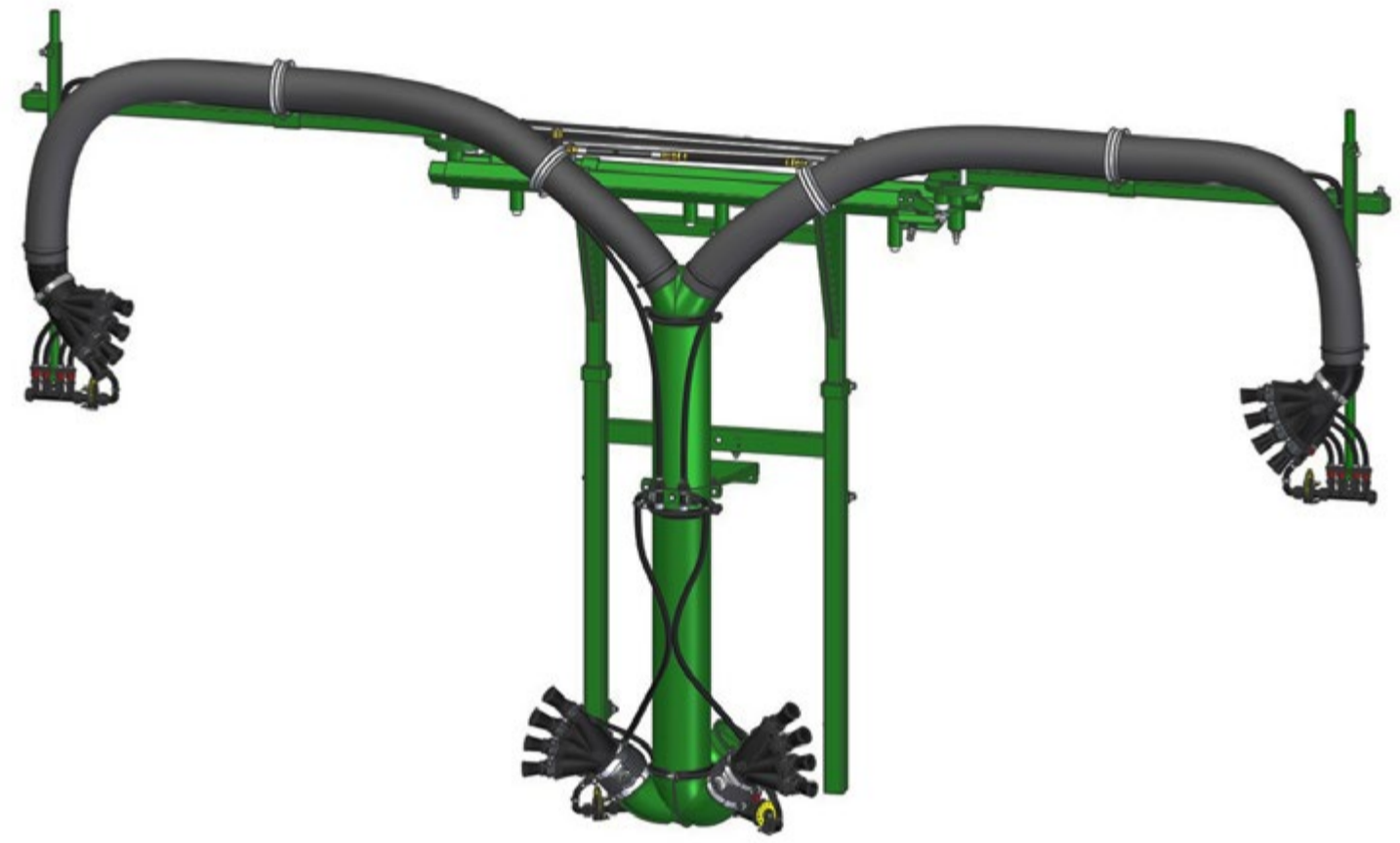
GREEN HUG - TESTATA 2 MANI + 2 MANI CON MOVIMENTAZIONE IDRAULICA PER REGOLAZIONE IN LARGHEZZA E CHIUSURA